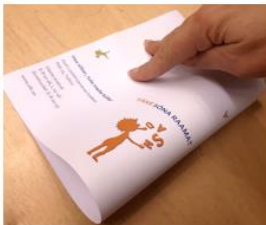
1. Voldi leht pikuti pooleks...