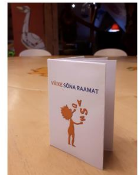
7. Raamat on valmis!