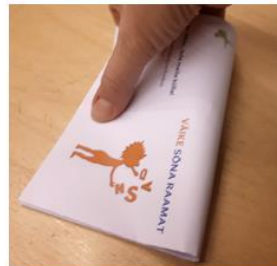
3. Voldi leht ka laiuti pooleks.