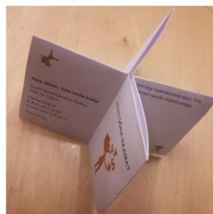
6. Neli lehekülge ülaltvaates.