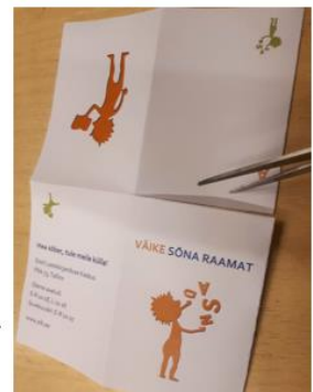
4. Tee lõige keskjoonele.