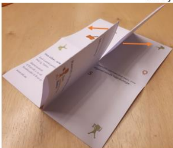
5. Haara otsanurkadest ja voldi raamatu leheküljed.